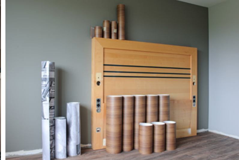
3. Schnelles Arbeiten durch optimale Baustellenlogistik.