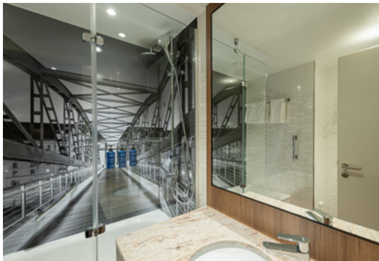
8. Fertiggestelltes Duschbad mit wasserfestem Hamburg-Motiv.