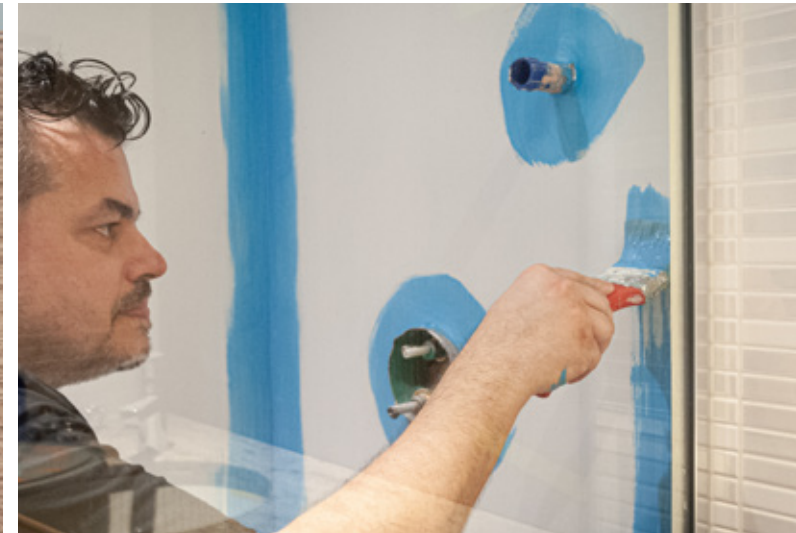
6. Wasserdichte Wandvorbereitung im Bad.