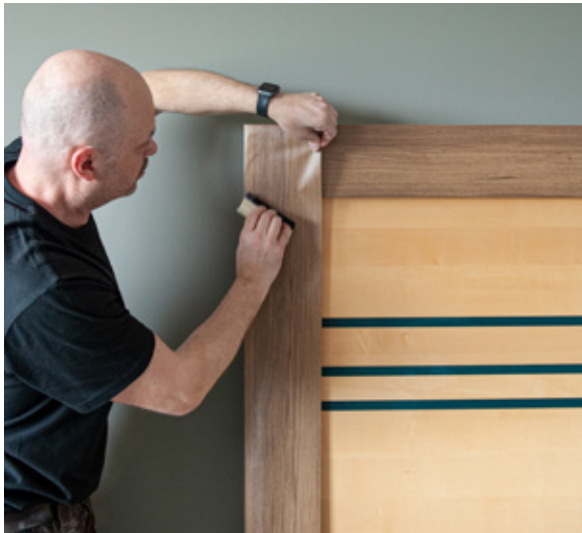
4. Präzise Ausführung.