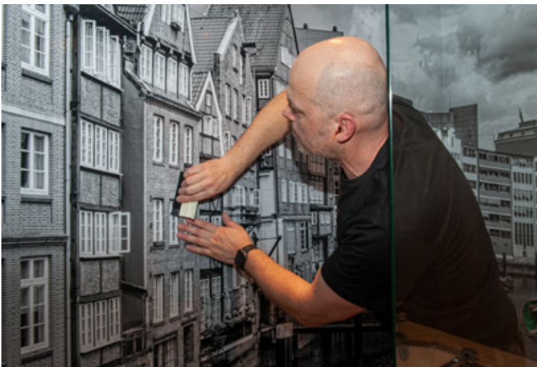
7. Hamburg-Motive werden wasserfest kaschiert.