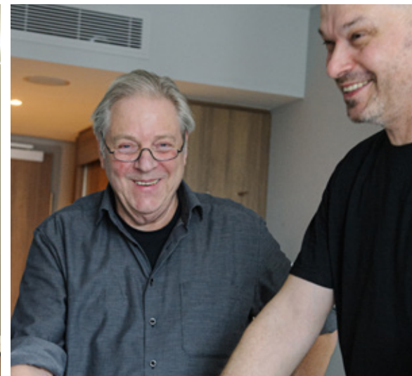
9. Auftraggeber und wir sind mit dem Ergebnis sehr zufrieden.