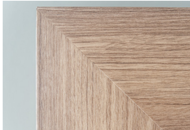
5. Perfektes Ergebnis.