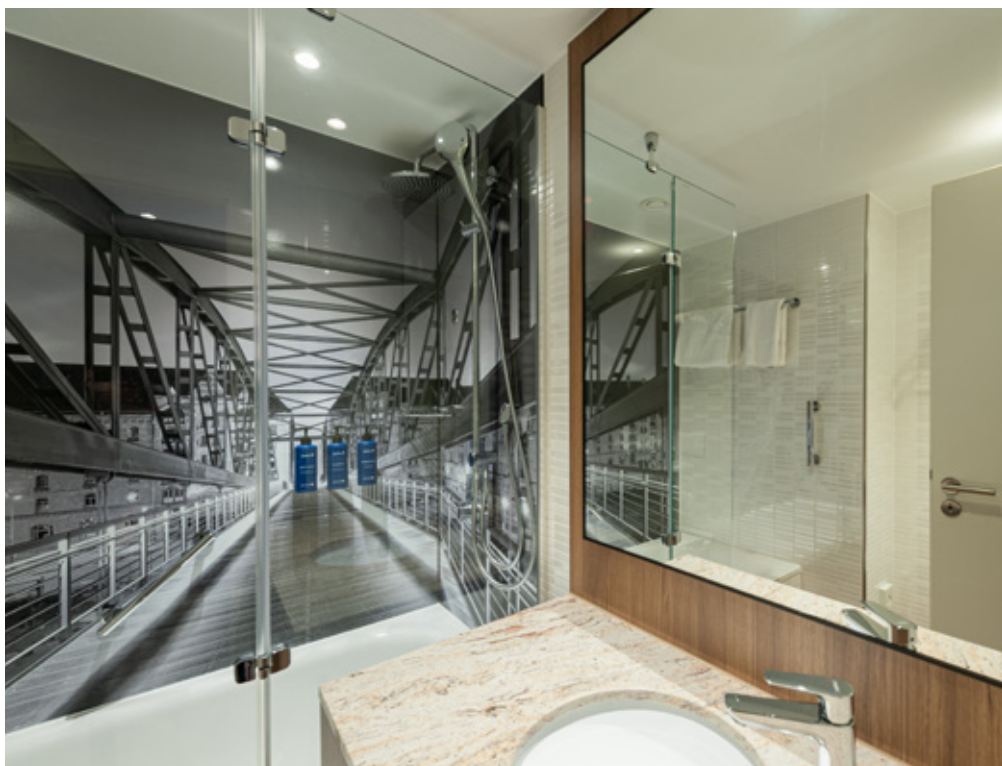
Fertiggestelltes Duschbad mit wasserfestem Hamburg-Motiv.